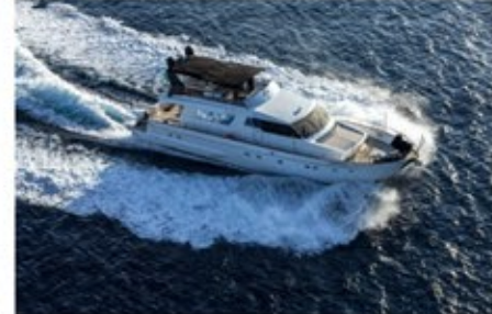
All We Need