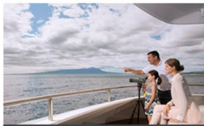
Yacht Santa Cruz II