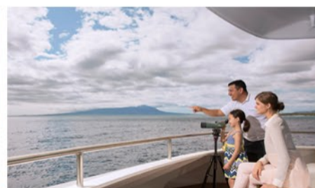
Yacht Santa Cruz II