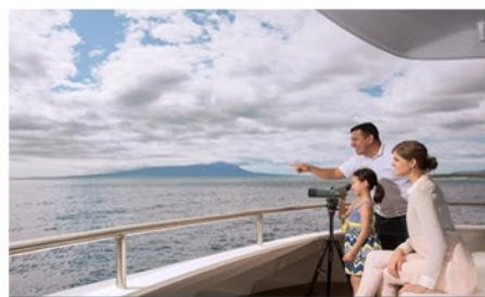
Yacht Santa Cruz II