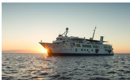
Yacht Isabela II