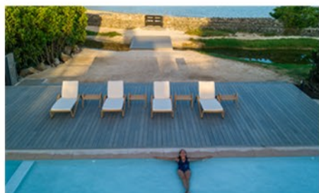
Finch Bay Galapagos Hotel