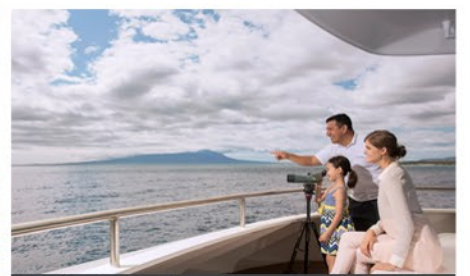
Yacht Santa Cruz II