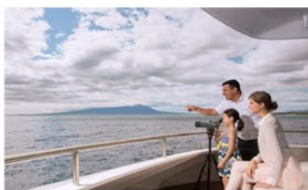
Yacht Santa Cruz II