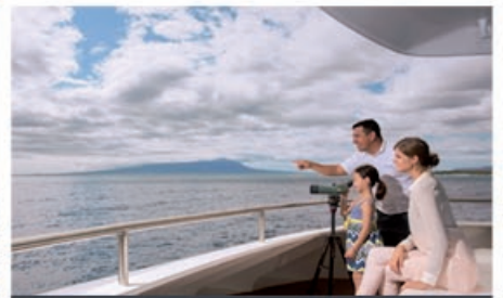
Yacht Santa Cruz II