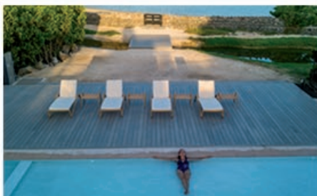
Finch Bay Galapagos Hotel