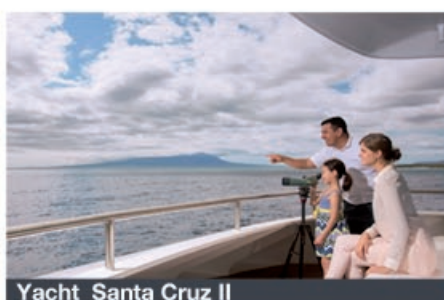
Yacht Santa Cruz II