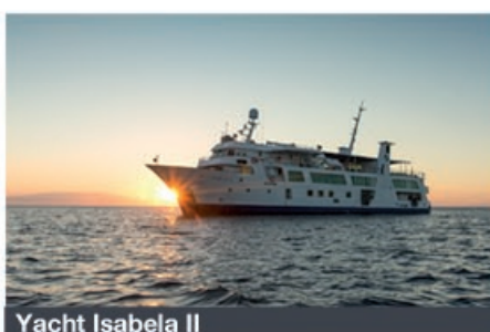
Yacht Isabela II