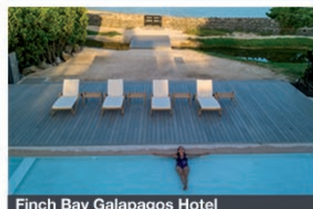
Finch Bay Galapagos Hotel