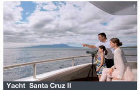
Yacht Santa Cruz II