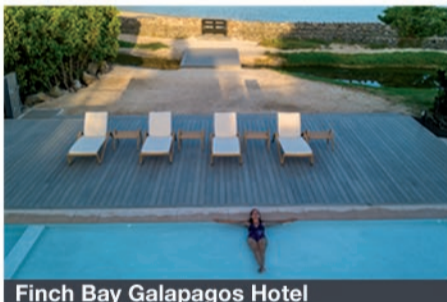
Finch Bay Galapagos Hotel