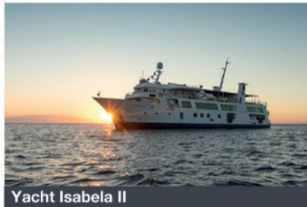
Yacht Isabela II