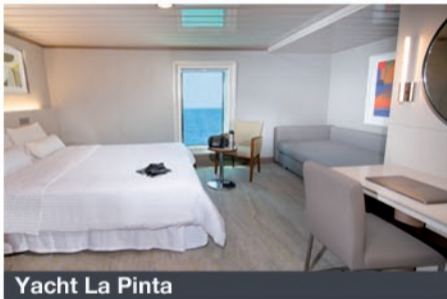
Yacht La Pinta

Nous vous remercions par avance pour vos votes et cette opportunité de faire passer votre message. Merci pour votre soutien !