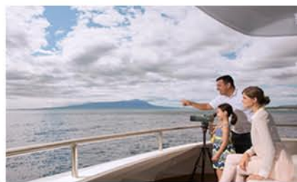
Yacht Santa Cruz II