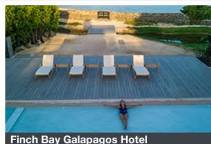
Finch Bay Galapagos Hotel