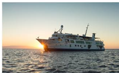
Yacht Isabela II