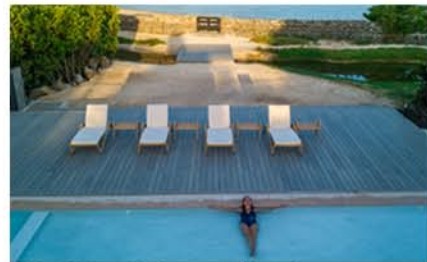
Finch Bay Galapagos Hotel