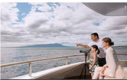
Yacht Santa Cruz II