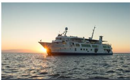
Yacht Isabela II