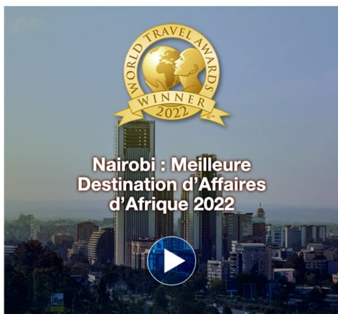
Nairobi : Meilleure Destination d'Affaires d'Afrique 2022